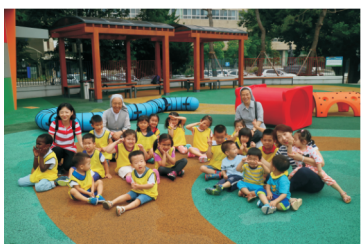
▲ 국립어린이 과학관 견학