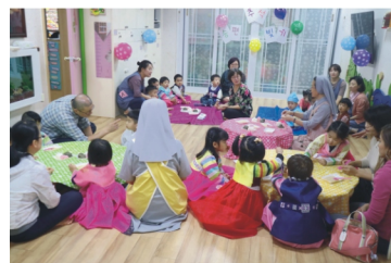
▲ 추석맞이 송편빚기